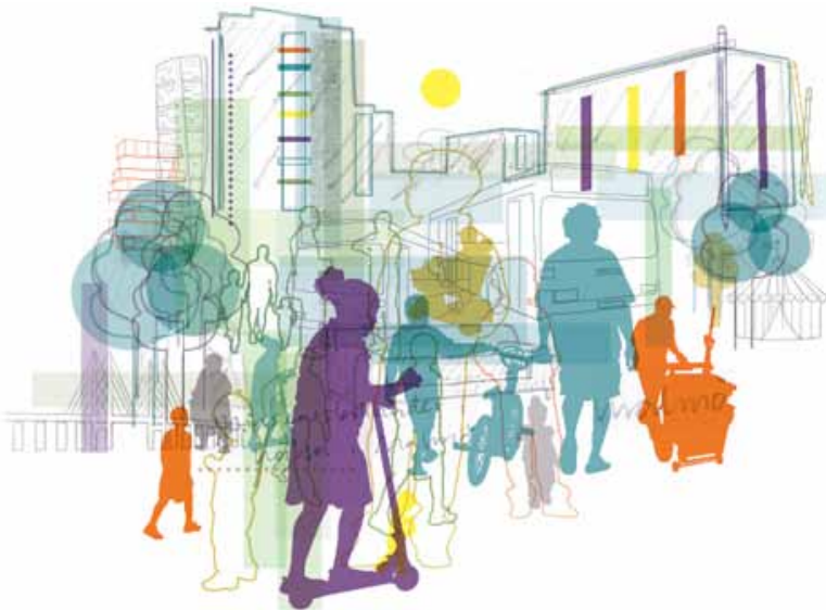
Illustration: Kommission för ett socialt hållbart Malmö