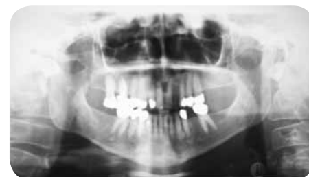
OPG-förkalkning av halspulsåder.